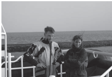
“Vrij en verantwoord? ... Maar niet zonder onze hulp!”