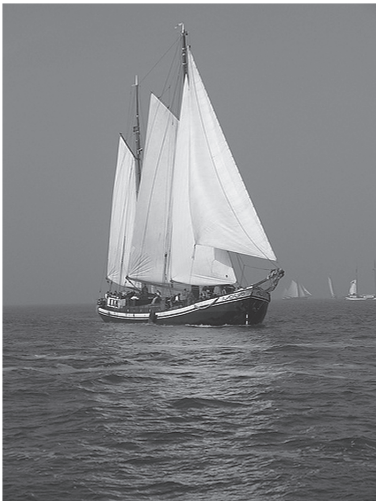
In vol zeiltenue