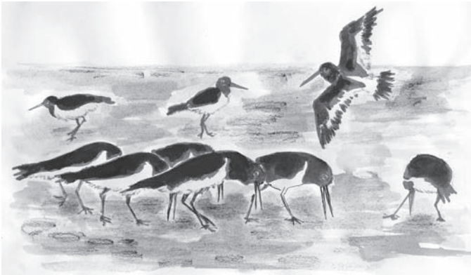
tepiet, tepiет, tepiет ...

recht naar beneden wijst. Hoewel de scholekster nog steeds een zeer algemene broedvogel is, neemt hun aantal opvallend af. Dat wordt geweten aan de toenemende voedselschaarste in de Waddenzee. Of moet het omgedraaid worden en moet je zeggen: "teveel vogels willen leven rond de Waddenzee, meer dan de Waddenzee aankan"?