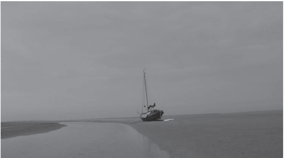
in wankel evenwicht

Daar aangekomen probeerde ik in een combinatie van plaatselijke bekendheid (van een jaar geleden!) en hydraulisch inzicht (van mijn opleiding uit 1978), de loop van het stroompje te verkennen.